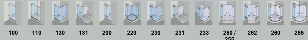
100 110 130 131 200 220 230 231 233 250 / 255 1-flüglig 252 260 265