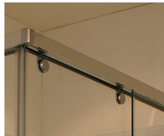
Abb: Dusche mit Wandverkleidung aus Glas rückseitig RAL 9010

Zwei Laufwagen halten und führen jeden Türflügel